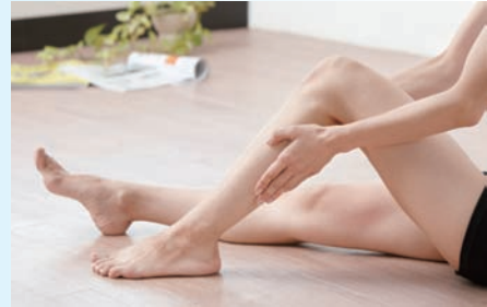
気になる脚の凸凹部分にサツと塗るだけ、ス〜ッと爽やかな塗り心地。ラベンダーの香りで心もリラックス。