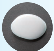
メントールの働きでス〜ッと爽やかな塗り心地!