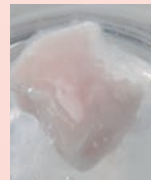
本品にラードを浸けると周りから分解されて溶け出します!

肌に優しい天然ダイズエキス99%の毛穴引き締めオイルです。毛穴の汚れ、詰まりが気になる小鼻などに塗るだけ!ダイズナノコロイドが毛穴に詰まった脂を根こそぎ溶かし、空になった毛穴を白金がキュッと引き締めます。ゴシゴシ擦らないから肌ストレスなし!塗って5分後洗い流せば、毛穴レスのツルツルなめらか肌に。ファンデーションやマスカラなどのメイク落としにも大活躍!!